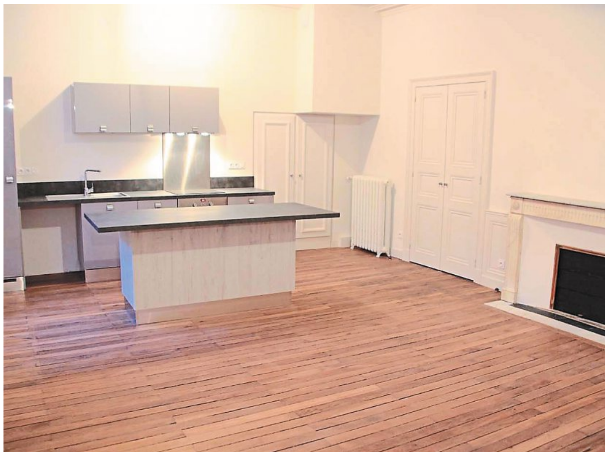
Les cuisines sont livrées entièrement équipées, comme les salles de bains.

Il aura fallu vingt mois aux ouvriers pour transformer la cité U de fond en comble. « L'espace était extrêmement contraint, explique Janet Guinaudeau. Nous avons dû travailler en milieu occupé, puisque les commerces du passage Pommeraye, juste en dessous, étaient ouverts. »