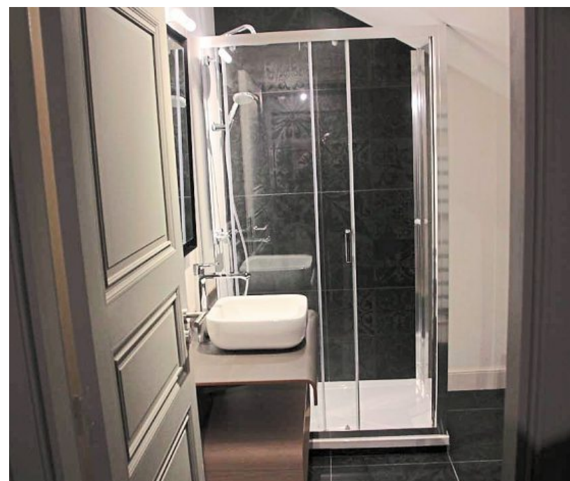
La salle de bains d'un T3, avec un design très moderne.