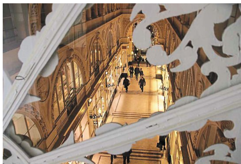
L'un des T6 bénéficie d'une vue directe sur le passage Pommeraye.